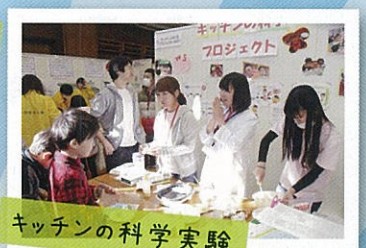
キッチンの科学実験