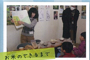
お米のできるまで