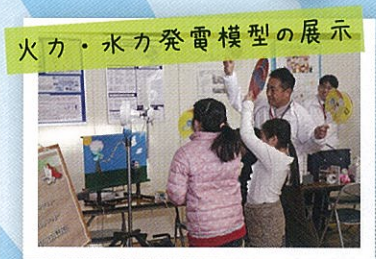
火力・水力発電模型の展示