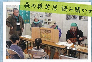
森の紙芝居読み聞かせ