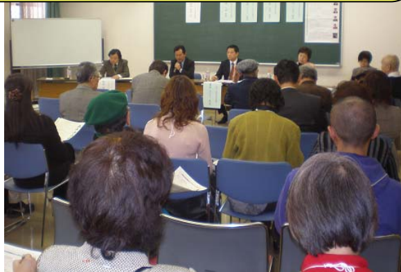
パネルディスカッションも大盛況！