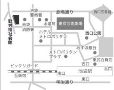
池袋西口 徒歩約7分