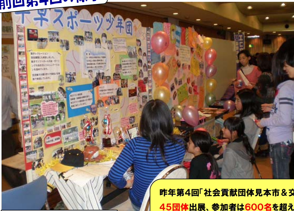
会場内は大賑わいで凄い熱気！

今回はホンモノ「フクロウ君」登場するよ！ 可愛いフクロウ君見てみよう！ 大集合！