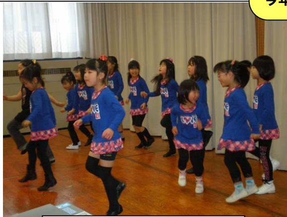
子どもたちもダンスを披露♪

昨年第4回「社会貢献団体見本市 & 交流会」は大盛況で、 45団体 出展、参加者は 600名 を超えました！ 懇親会参加者も100名の方々にご参加いただきました。 今年も昨年同様、皆様方と大いに盛り上がりましょう！